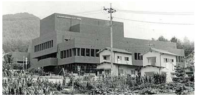
開館当時の外観。草が生い茂っています。