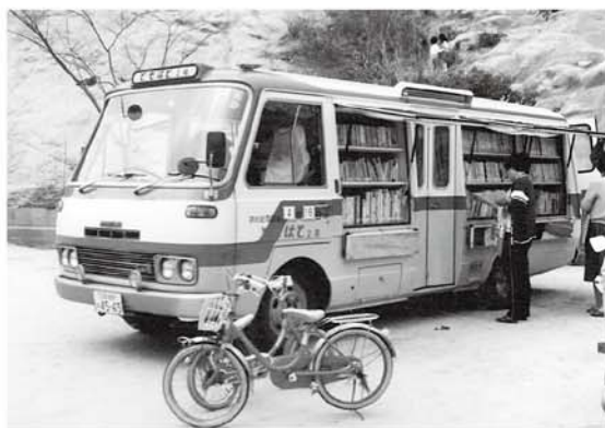
ともはと号の巡回の様子 昭和62年（1987年）

また、浅野図書館時代の昭和39年（1964年）には、図書館の利用が不便な地域に本を届けようと移動図書館車「ともはと号」の巡回サービスが始まりました。現在の「ともはと号」は約2,000冊の本を積んで、地域のサービスポイントのほか、高齢者施設や特別支援学校にもおもむくなど、市内16箇所を巡回しています。