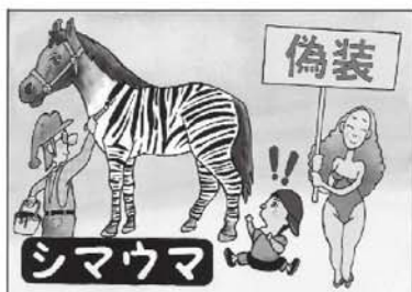
第16回おもしろその年まんが大賞