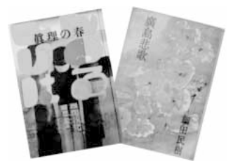
左)『真理の春』(中央公論社 S5) 右)『広島悲歌』(世界社 S24)

作家 ほそだ たみき 細田 民樹 (明治25年～昭和47年) は、東京で生まれ、父の郷里 山県郡壬生村(現 北広島町)で育ち、大学在学中に文壇デビューしました。3年間の広島騎兵第五連隊での経験をもとに、軍隊批判を主題に執筆した『或兵卒の記録』(大正13年刊)は、大きな反響を呼びました。その後、プロレタリア文学の影響を受けた作品なども発表し、『真理の春』(昭和5年)はベストセラーになります。戦中に郷里へ疎開、戦後は雑誌「中国文化」や「ぎんのすず」へ作品を発表し、復興期の広島でも活動しました。この文学展では、代表作「真理の春」をはじめとする自筆原稿や著作などを展示し、細田民樹の生涯と文学をご紹介します。