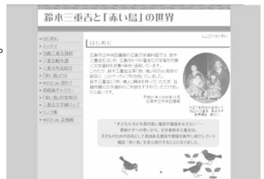
Web 広島文学資料室 鈴木三重吉と「赤い鳥」の世界

平成21（2009）年4月に掲載した Web 広島文学資料室「鈴木三重吉と『赤い鳥』の世界」 は、大変ご好評をいただき、研究者の方からもお問い合わせをいただいております。次は、原民喜について準備中です。