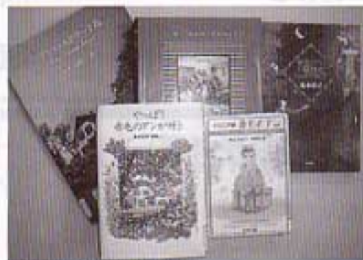
中央図書館の1月の展示。 テーマは「モンゴメリ」。ご存じの通り「赤毛のアン」 で知られるカナダの有名な作家である。