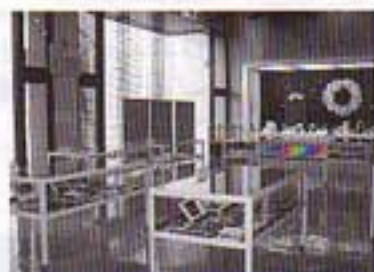
中央図書館の展示ホール。

中央図書館では年に数回、2階展示ホールにて、企画展を開催しています。普段書庫で保管している貴重な資料が展示されることもありますので、こちらもおあわせてご覧ください。