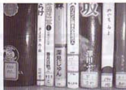
広島市立図書館で使われている請求記号