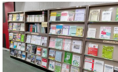
↑中央図書館 2階 新聞雑誌閲覧室