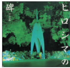
『ヒロシマの碑』 宅和 純／著、広島県教職員組合／編、 広島平和教育研究所／編 広島県教育用品 1996年