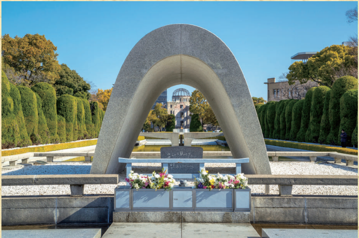
「広島平和都市記念碑(原爆死没者慰霊碑)」