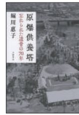
『原爆供養塔』 堀川 恵子／著 文藝春秋 2015年