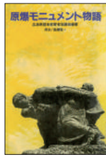
『原爆モニュメント物語』 広島県歴史教育者協議会／編著 平和文化 1984年