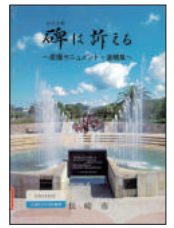
『碑は訴える』 長崎国際文化会館／編 長崎市 1986年