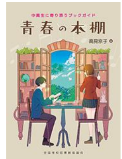
『青春の本棚』 高見 京子 編著 全国学校図書館協議会