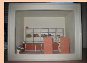
※写真は制作中のものです。