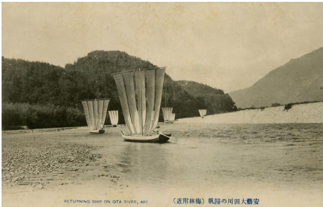
RETURNING SHIP ON OTA RIVER, AKI