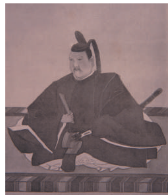
浅野長晟画像(『広島市史』第1巻 (広島市/編 名著出版 1972年)より)

そして、元和5年(1619年)、広島城無断修築の罪で改易となった福島正則に代わり、広島藩42万6千石に加増転封となり、旧暦8月8日に広島城に入城しました。以来明治2年(1869年)の版籍奉還に至るまで、250年間にわたり浅野氏が広島藩を治めました。