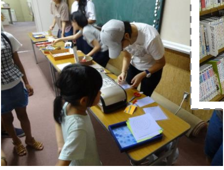
令和元年度の活動の様子