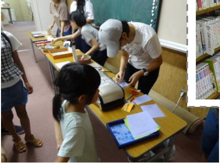
令和元年度の活動の様子