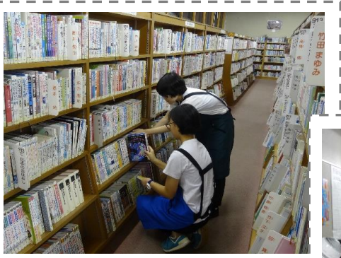
令和元年度の活動の様子