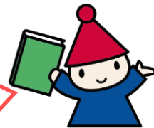
こども図書館 マスコットキャラクター 「ブックル」

こども図書館の行事や館内作業をサポートする中学生・高校生の会です。メンバーは随時募集中! キミと一緒に図書館で活動してみない?