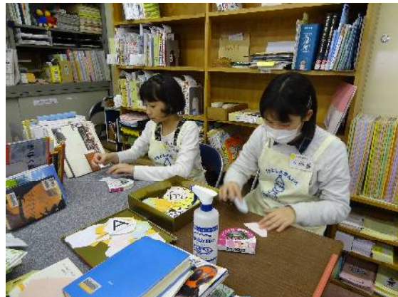
一日図書館員 中学・高校生