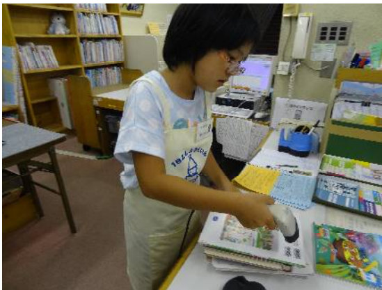
一日図書館員 小学生