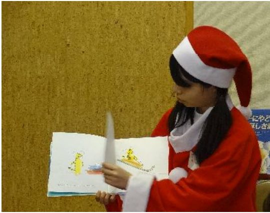
ライブラリー・サポーターズ 「クリスマスのおはなし会」