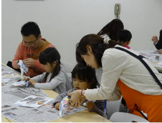
子ども読書まつり 「ペーパークラフトでクルマをつくろう」